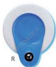
5. Elektroda naklejana na brzuch