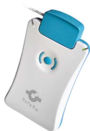
3. Kolektor danych Zuzamed