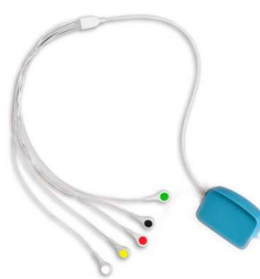
1. Kable pacjenta z wtyczką do kolektora