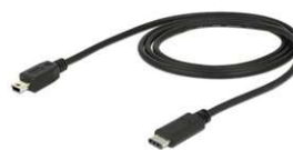
2. Kabel przyłączeniowy do ładowarki oraz do połączenia z telefonem